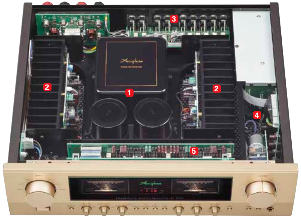
▲ Immer schön anzusehen: Der gewohnte Anblick eines Accuphase-Vollverstärkers mit zentralem Netzteil (1), den Endstufeneinheiten (2) sowie dem Eingangs- (3), Vorstufen- (4) und Kontrollsektor (5).

Wo die meisten Mitbewerber in Purismus machen, verwöhnt der E-270 seinen Besitzer mit Tape-Out, Mono-, Muting- und Loudness-Schaltern sowie Balance- und Klangreglern. Auch eine potente Kopfhörerbuchse ist vorhanden. Diese liefert bis zu sieben Volt bei einem Ausgangswiderstand von nur zwei Ohm. „Daran könnte man glatt Boxen anschließen“, so „Messdiener“ Uli Apel.