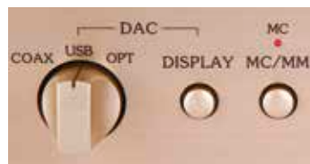
Die für MM- und MC-Abtaster geeignete Phono-Karte AD-30 verschwindet in einem Schacht auf der Rückseite (l.). Zwischen den Tonabnehmertypen schaltet man auf der Frontplatte um (o.). Neben dem D/A-Modul DAC-40 ist an dieser Stelle auch ein weiterer Line-Eingang möglich (um 160 Euro).