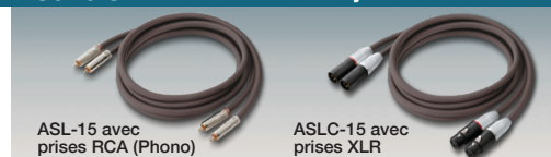
ASL-15 avec prises RCA (Phono)