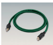
Câble HS-LINK AHDL-15