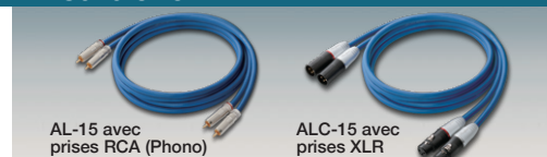
AL-15 avec prises RCA (Phono)